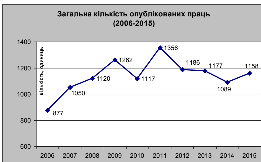
Рис.6. Загальна кількість опублікованих праць (2006 – 2015 рр.)

4. Втримання на належному рівні загальної кількості публікацій (Рис.6, 7). У 2015 році було опубліковано 1158 найменувань друкованої продукції (станом на 21.12 2015 р.) (у 2014 році – 1089 одиниць).