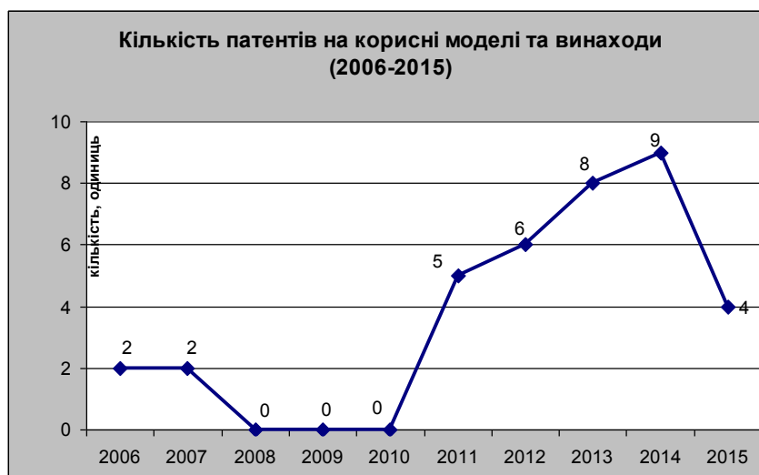
Рис.8. Кількість отриманих патентів на корисні моделі та винаходи

5. Досягнення стабільних позитивних зрушень у сфері отримання патентів (Рис.8). Зокрема, якщо протягом 2006-2010 рр. викладачами університету було отримано 4 патенти на винаходи та корисні моделі, то у 2015 році на кафедрі хімії отримано таку ж кількість - 4 патенти лише за один рік.