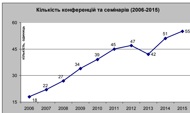
Рис.9. Динаміка організації наукових форумів (2006 – 2015 рр).

7. Посилення позитивної динаміки у сфері організації наукових форумів. У 2015 році кафедри університету були організаторами та співорганізаторами 16 міжнародних, 25 всеукраїнських та регіональних і 14 вузівських конференцій, семінарів, круглих столів (станом на 21.12.2015 р.).