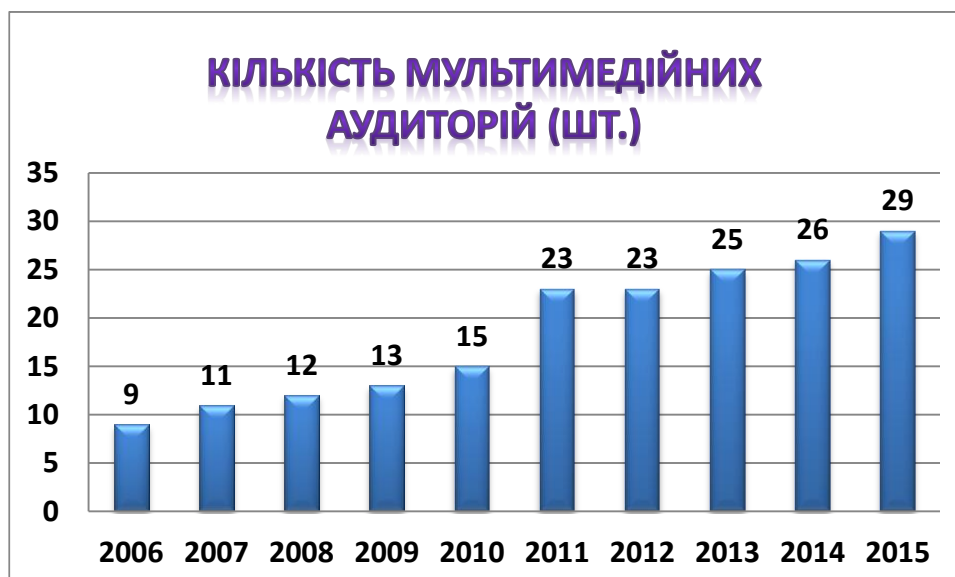
Рис.3. Динаміка кількості аудиторій, обладнаних мультимедійною технікою

Зокрема, за останні п'ять років їх кількість зросла майже у 2 рази ( з 15 - у 2010 р. до 29 - у 2015 р.).