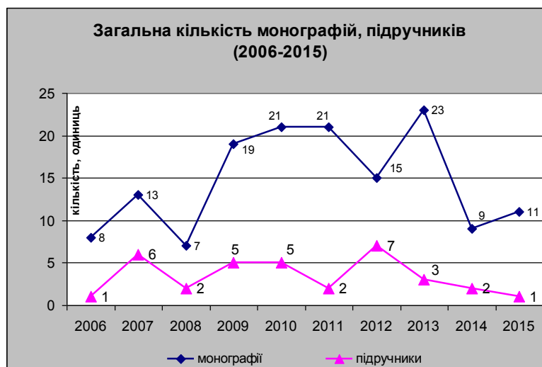
Рис.7. Загальна кількість монографій та підручників, виданих у 2006 – 2015 рр.

З них - 1 підручник, 11 монографій та 4 навчальних посібники з грифом МОН України (станом на 21.12 2015 р.).