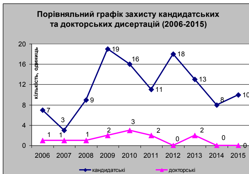
Рис 4. Захист викладачами дисертаційних робіт (2006 – 2015 рр.)

За останні 10 років (2006-2015 рр.) викладачами вузу було захищено (Рис 4) 114 кандидатських і 12 докторських дисертацій. Якщо взяти попередні 10 років (1996-2005 рр.), то ці показники відповідно становлять – 79 кандидатських і 6 докторських. Таким чином, маємо прорив із захисту кандидатських дисертацій в 1,4 рази, а докторських – в 2 рази.