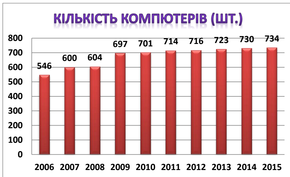
Рис.1. Динаміка збільшення кількості комп'ютерів

Зокрема, якщо у 2005 р. в університеті працювало 400 комп'ютерів, то у 2015 р. – 734, що майже вдвічі більше.