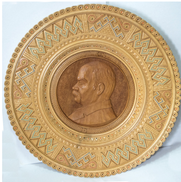
Блюдо декоративне із зображенням Т. Шевченка. 1961 р. Дерево, різьба, інкрустація