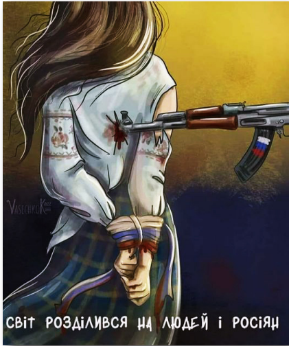
Світ розділився на людей і росіян