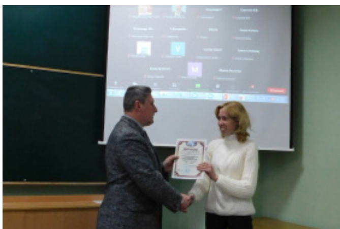
Серед кафедр природничого напрямку: