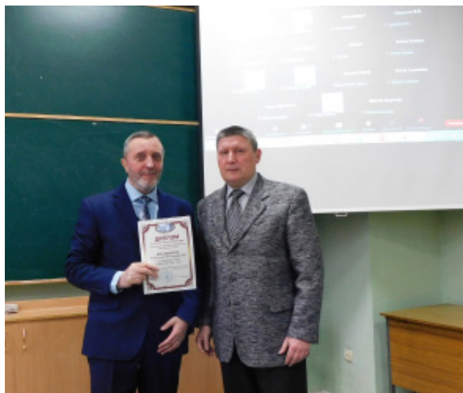
У галузі природничих наук: