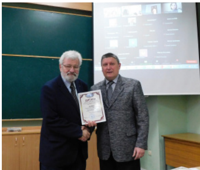
У галузі гуманітарних наук:

Переможці конкурсу «Науковець року університету – 2022»