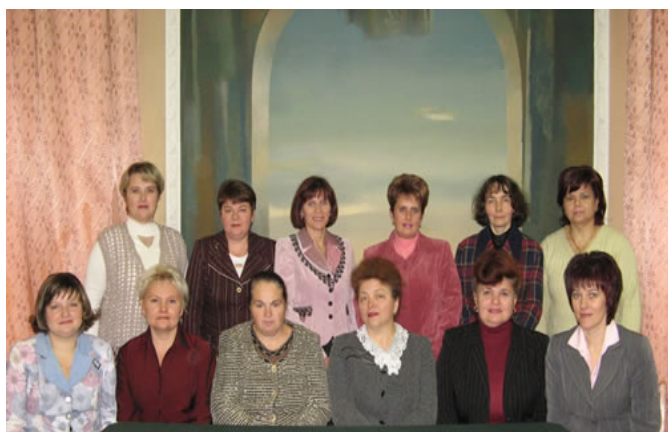
Серед кафедр гуманітарного напрямку: