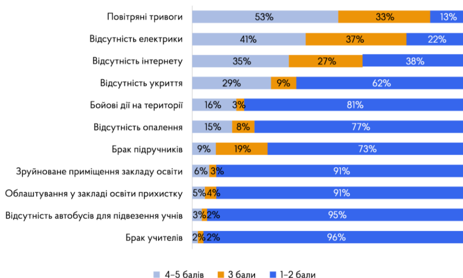
Рис.1. Результати опитування керівників закладів освіти [1]

За цими відсотками – дитячі трагедії. І проблеми, що окреслені результатами дослідження, потребують негайного вирішення, так як це питання майбутнього нашої держави.