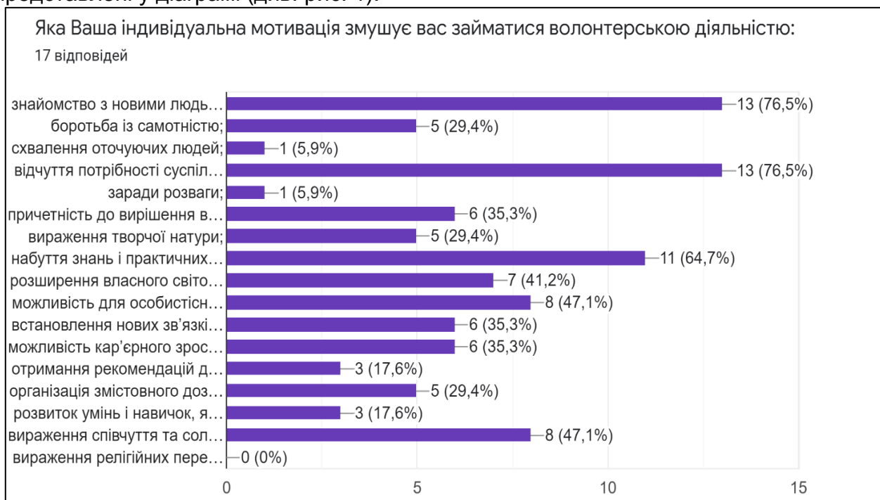
Рис. 1. Яка Ваша індивідуальна мотивація змушує вас займатися волонтерською діяльністю

Після проведеного теоретичного аналізу означеної проблеми, логічний ланцюг спонукав провести емпіричне дослідження по вивченню особливостей індивідуальної мотивації, яка змушує молодь займатися волонтерською діяльністю і результати представлені у діаграмі (див. рис. 1).