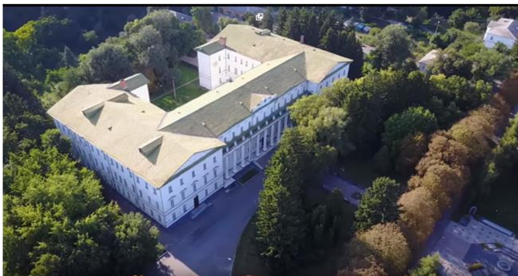
Старовинна будівля Ніжинської вищої школи. 1805 рік заснування

За результатами конференції учасникам від Оркомітету будуть надіслані: програми, сертифікати та надруковані матеріали (через «Нову пошту» ЗА РАХУНОК ОТРИМУВАЧА).