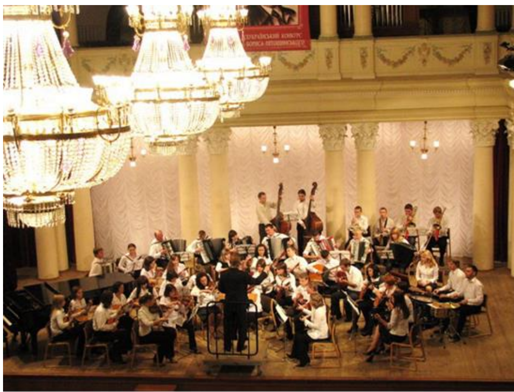
Оркестр народних інструментів НДУ імені Миколи Гоголя під орудою народного артиста України, професора Миколи Шумського