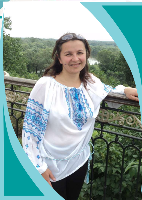
Шановна Євгеніє Іванівно!

Хай будуть з Вами здоров'я та сила, Хай доля буде ласкава і щира! Щоб ніколи не знали Ви втоми! Хай мир і злагода будуть у домі, Хай Господь дарує надію й тепло На довгі літа, на щастя й добро!