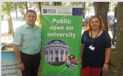
Проект соціальної дії «Public open air university» отримав підтримку