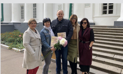
Святкові урочистості з нагоди Дня працівника освіти