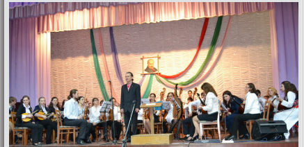
Зведений оркестр народних інструментів здобув «Гран-прі» на міжнародному фестивалі у Львові