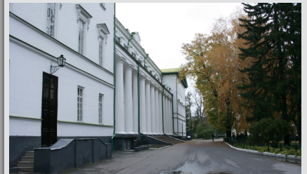
Ніжинській вищій школі – 200!