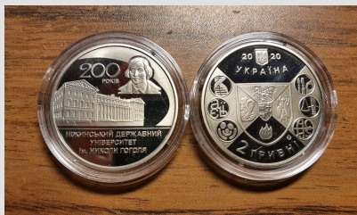
В Україні відчеканено нову ювілейну монету до 200-річчя Ніжинського вишу