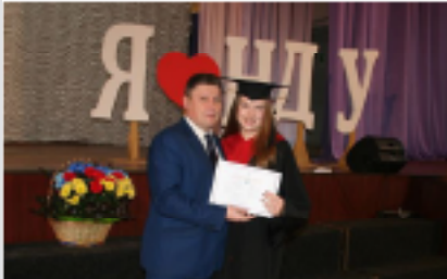
Випуск магістрів 2020