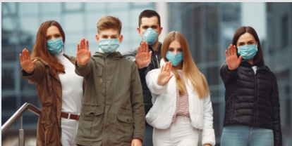
Всеукраїнське соціологічне інтернет опитування «Українське студентство в умовах епідемії коронавірусу»