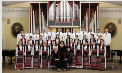
Творчі здобутки Молодіжного хору «Світич»