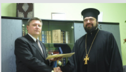
Підписання Договору про співпрацю з Київською православною богословською академією