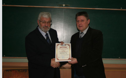
Підсумки наукових конкурсів