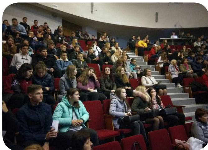
Профорієнтаційна робота у місті Славутич