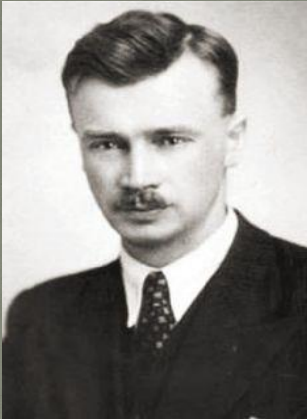
Олег Ольжич (Кандиба)