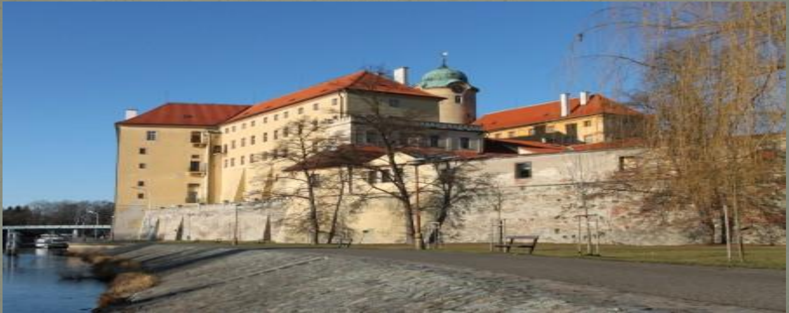
Українська господарська академія.

З липня 1922 родина оселилася в Подебрадах у Чехословаччині. Батько на той час був ректором Української господарської академії. Тут Олена увійшла до середовища молодих українських поетів та інтелектуалів. У Чехії Олена отримала «матуру» — атестат.