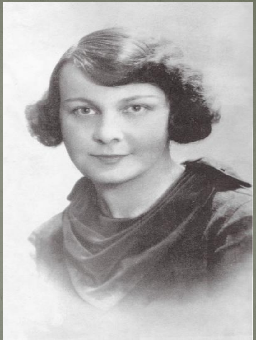
Олена Теліга. 1936

У 1937 році, виступаючи перед Українською Студентською громадою у Варшаві, Олена Теліга висловила своє захоплення фашистськими рухами у Європі.