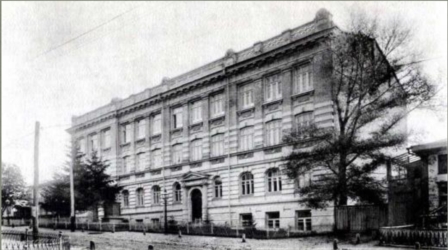
Гімназія Олександри Дучинської.

У 1918 разом з родиною переїхала до Києва. Тут вона навчалася в Жіночій гімназії Олександри Дучинської.