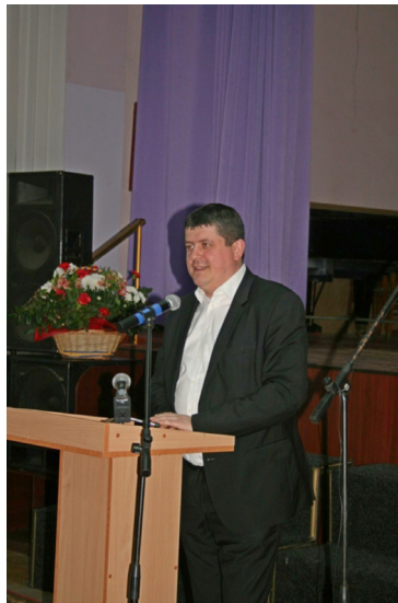
Бурбак Максим Юрійович, народний депутат України, внук Ф.С. Арвата