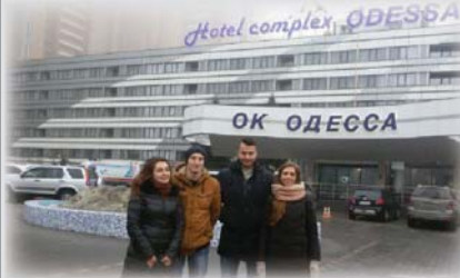
Наші на «Лізі сміху»