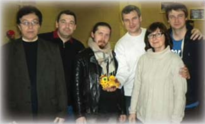
«МіФ» – знову чемпіони