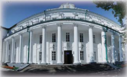
Ліцензування спеціальності «Журналістика»