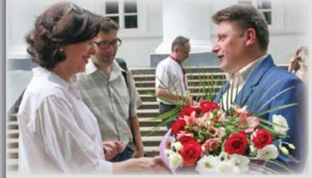
Віце-спікер Верховної ради України у Ніжинському виші