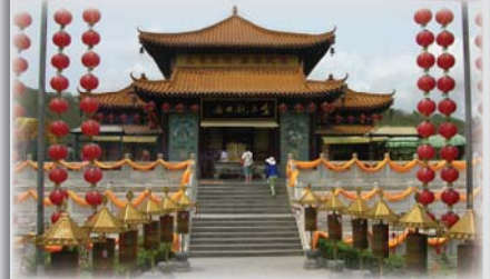
Міжнародні наукові зв'язки розширено! Візит делегації Гоголівського вишу до Китаю