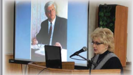
I Мистецько-педагогічні читання пам'яті професора О.Я. Ростовського