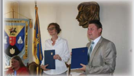
Підписано угоду про співпрацю між НДУ та Goethe-Institut в Україні