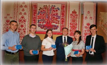
Вручення стипендій Президентського Фонду Леоніда Кучми