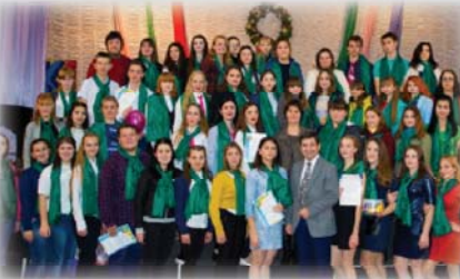
Факультету психології та соціальної роботи – 15!