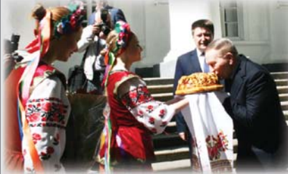
Візит екс-Президента України до Гоголевого вишу