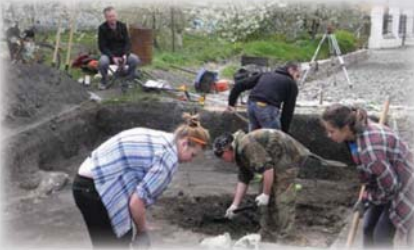
Ніжинські підземелля – шлях до мрії