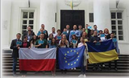
Українсько-польський діалог про виклики для сучасної демократії