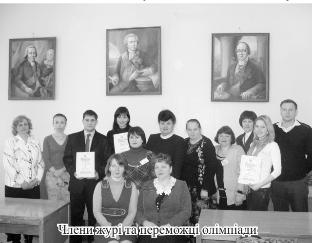
Члени журі та переможці олімпіади

Ми вчимося проводити олімпіади на російськомовних територіях нашої держави. Олімпіада показала, що ті студенти, які приїхали на II етап, глибоко володіють знаннями з української мови та літератури, оскільки завдання були складними і потребували глибоких знань.