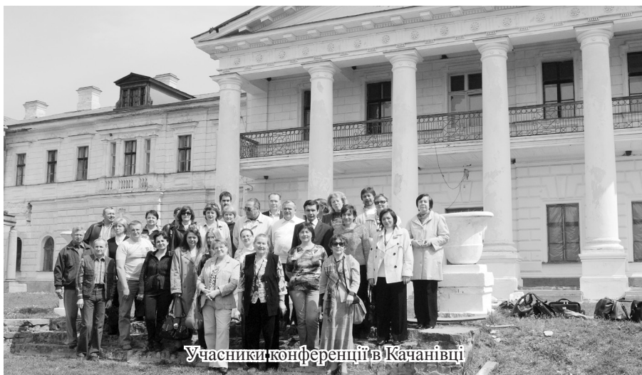
Учасники конференції в Качанівці

Підведення підсумків конференції та відзначення кращих доповідей відбулося в Національному історико-культурному заповіднику «Качанівка».