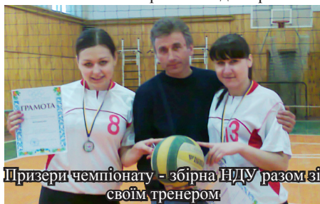
Призери чемпіонату - збірна НДУ разом зі своїм тренером