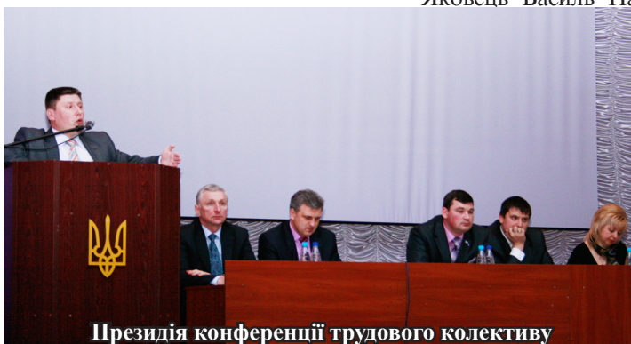
Президія конференції трудового колективу

Зауважень щодо проведення Конференції, в тому числі й таємного голосування, від делегатів, претендентів та присутніх представників Міністерства освіти і науки, молоді та спорту України та Чернігівської обласної державної адміністрації не надійшло.