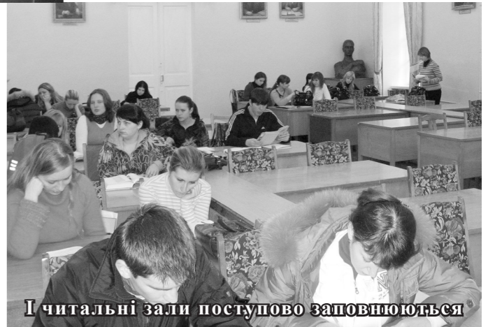
І читальні зали поступово заповнюються

Не зважаючи на досить напружений графік минулого семестру, екзамени не були такими вже страшними, як уявлялося на початку вересня. Студенти старших курсів традиційно попереджали новачків про труднощі, але, на щастя, це були лише розмови. Звичайно, підготовка до екзаменів була досить напруженою та копіткою справою, проте вартою отримано-