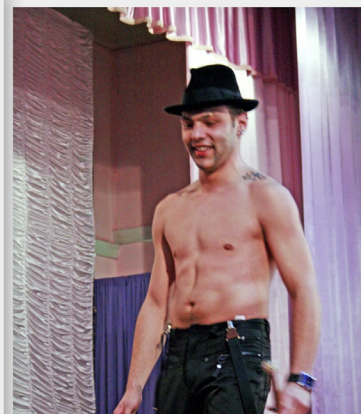
Учасники конкурсно-розважальної програми «Містер Університет» 64