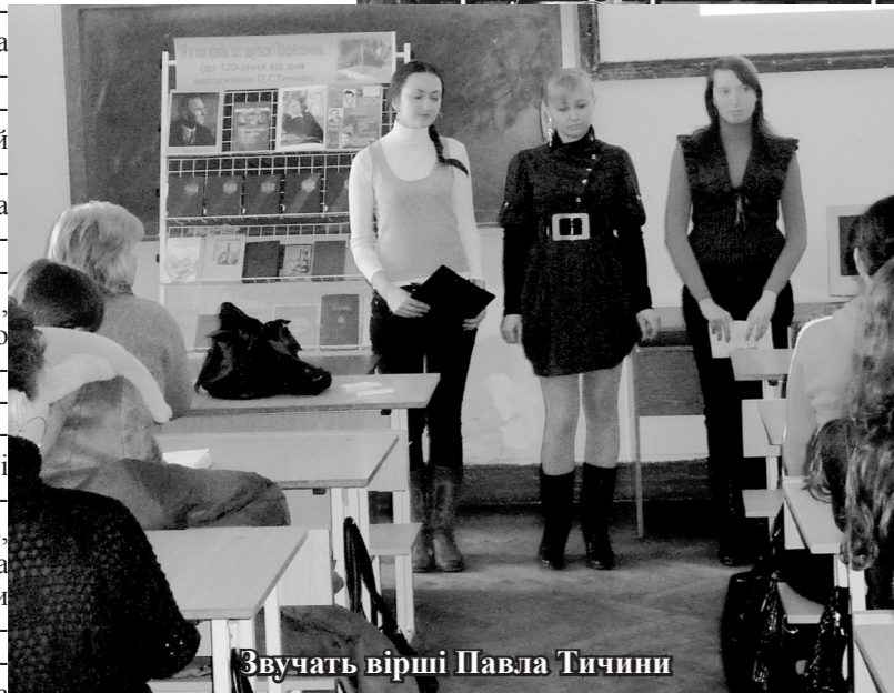
Звучать вірші Павла Тичини

Увагу присутніх також привернула виставка «Я з тих країн, що звуться Придесенням...», присвячена багатогранній творчості митця.