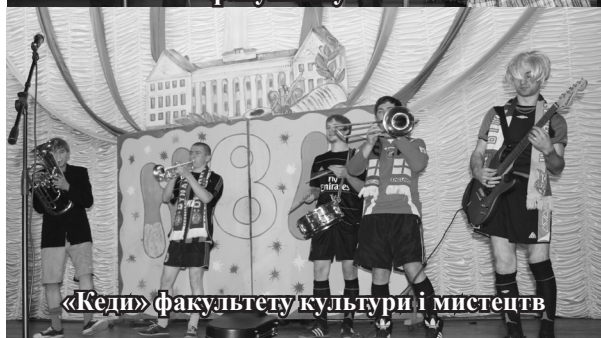
«Кеди» факультету культури і мистецтв