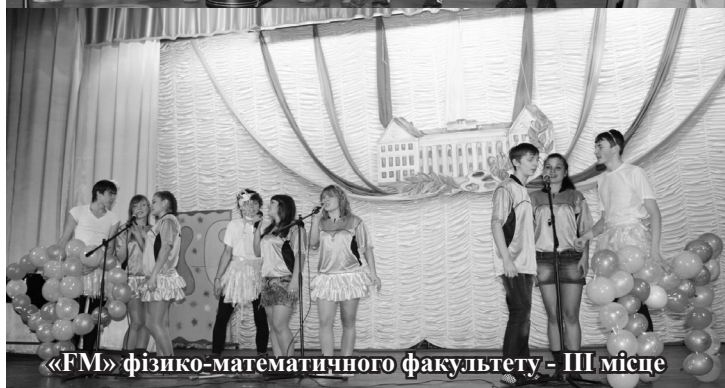
«FM» фізико-математичного факультету - III місце