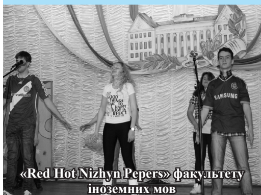
«Red Hot Nizhyn Peppers» факультету іноземних мов