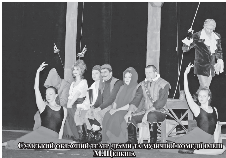
Сумський обласний театр драми та музичної комедії імені М.Щепкіна

Сумський обласний театр драми та музичної комедії імені М.Щепкіна показав на фестивалі трагікомедію Л.Жуховецького «Остання жінка сеньйора Хуана» у постановці художнього керівника театру, заслуженого артиста України Олександра Рибчинського. Вистава мала успіх у ніжинського глядача. Особливо запам'яталася майстерним виконанням ролі Кончіти мо-