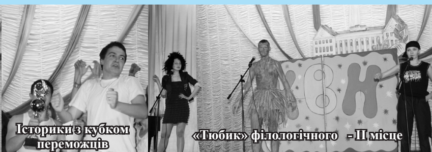
Історики з кубком переможців