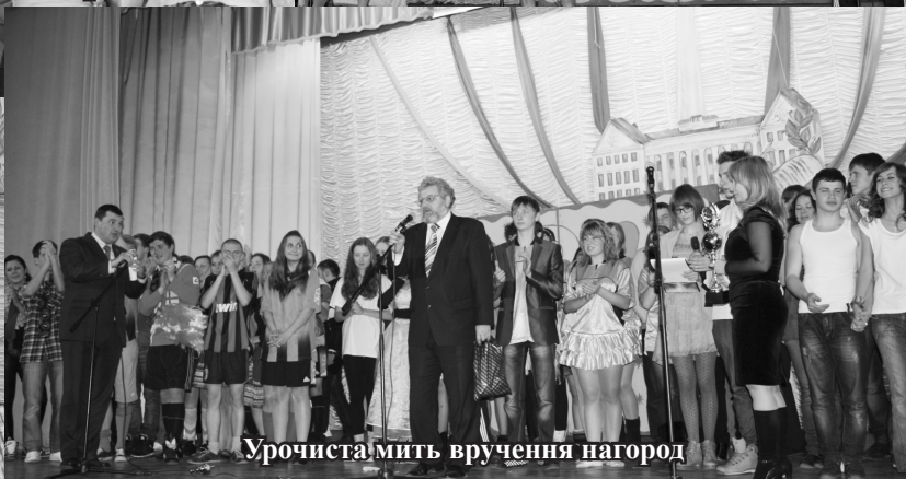
Урочиста мить вручення нагород