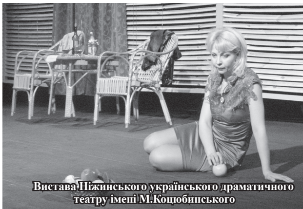
Вистава Ніжинського українського драматичного театру імені М.Коцюбинського

алізувати авторський та режисерський задум спектаклю. Прем'єра мала шалений успіх. Квитки на вистави львів'ян розкупаються протягом кількох годин. А тому ніжинці