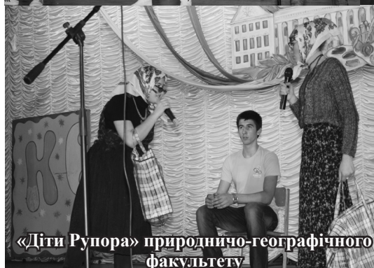
«Діти Рупора» природничо-географічного факультету