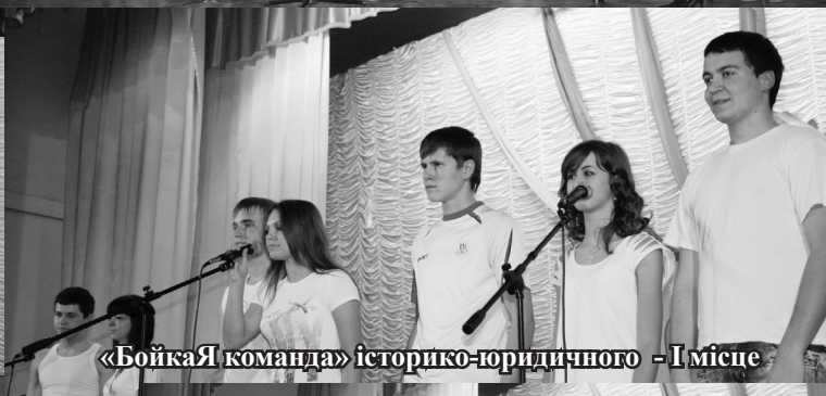
«БойкаЯ команда» історико-юридичного - I місце