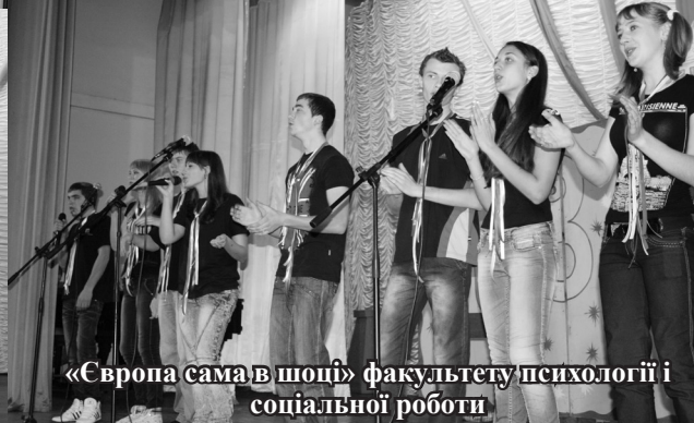
«Європа сама в шоці» факультету психології і соціальної роботи