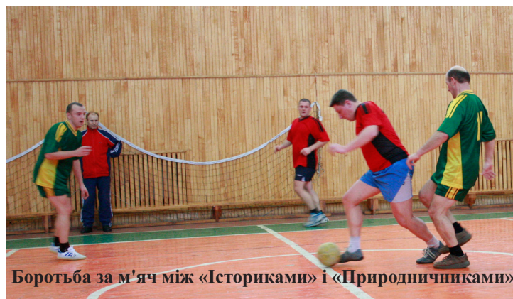
Боротьба за м'яч між «Істориками» і «Природничиками»