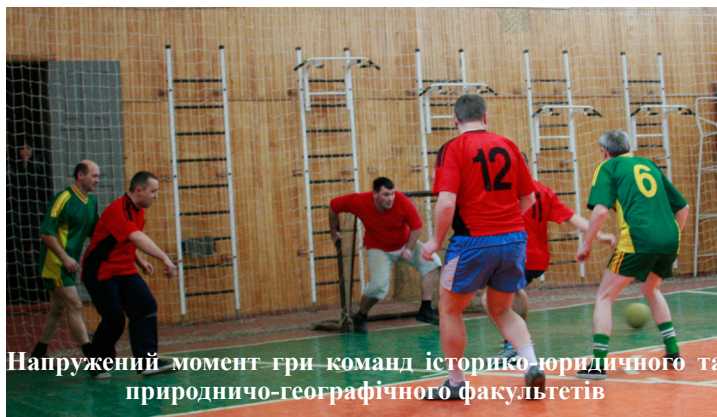
Напружений момент гри команд історико-юридичного та природничо-географічного факультетів

ки природничо-географічного факультету, що й перемогли з рахунком 4:3. Збірні факультету психології та соціальної роботи й адміністративно-господарчого відділу розпочали другу гру, яка вирізнялася накалом емоцій та спортивним азартом,