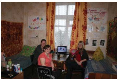
2 гуртожиток, 57 кімн.