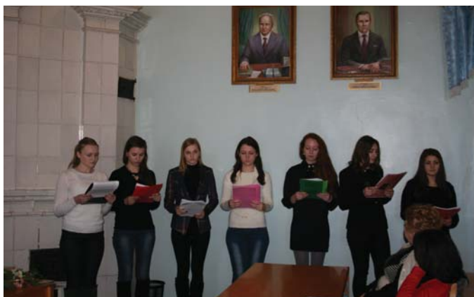
Студенти філологічного факультету

культурологічне та наукове значення, адже вона внесла великий обсяг нової, корисної, суб'єктивної інформації про Гоголя з різноманітних джерел.