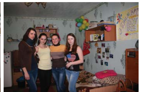
4 гуртожиток, 628 кімн.