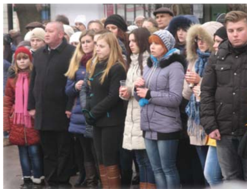
Студенти НДУ ім. М. Гоголя