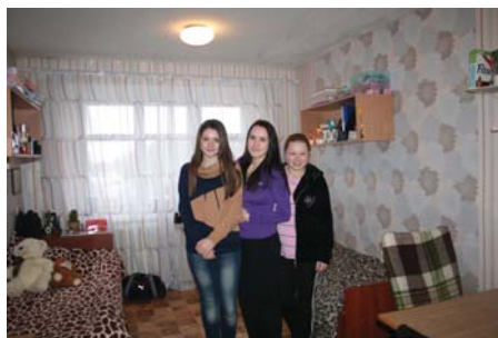
3 гуртожиток, 115 кімн.