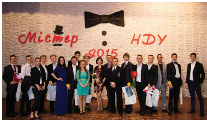
Містер НДУ 2015