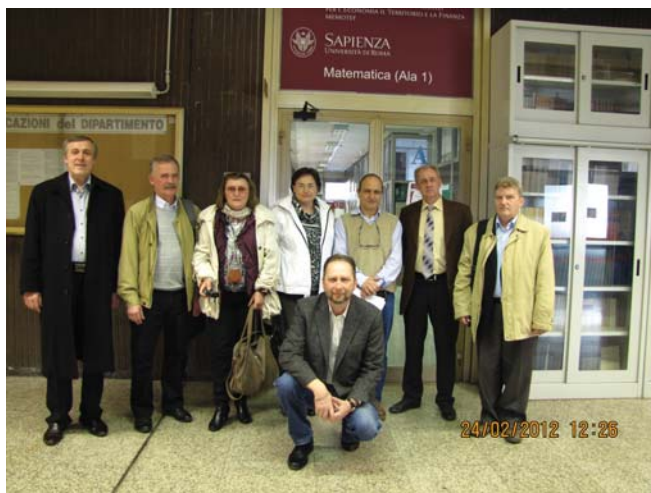
Викладачі факультету у складі української делегації під час відвідування Римського університету Sapienza