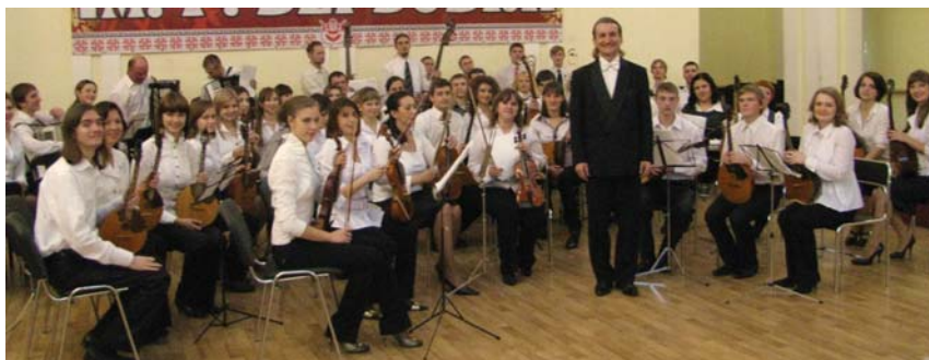
Оркестр народних інструментів

Школа баянного виконавства представлена вагомим творчими здобутками вихованців класу заслуженого артиста України, кандидата мистецтвознавства,