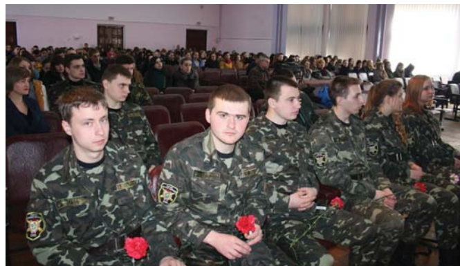
Вручення погонів молодшого лейтенанта

вих заходів, які проводяться в університеті;